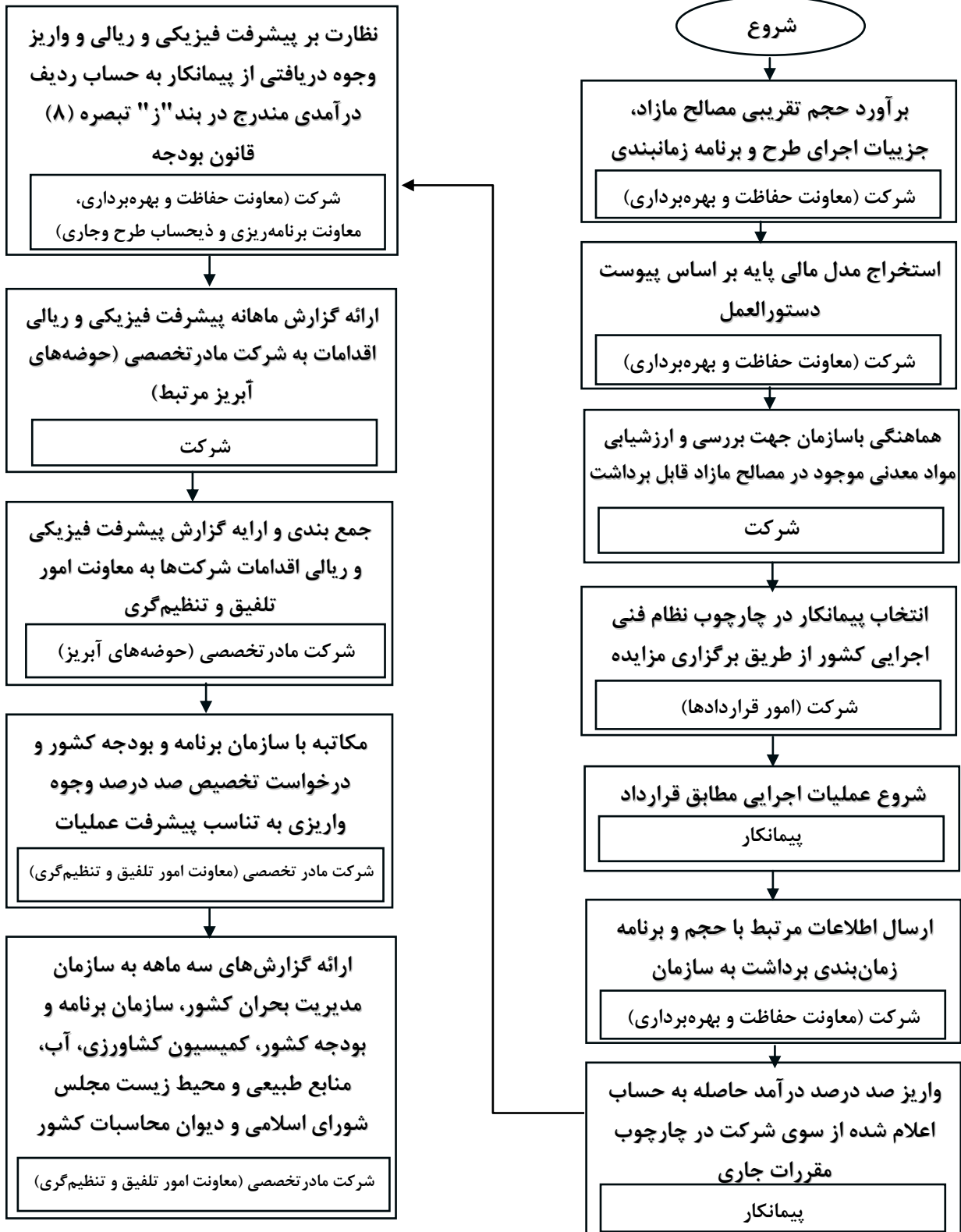
شکل (۱): گردش کار بهره‌برداری از مصالح مازاد رودخانه‌ای در قالب قرارداد مزایده